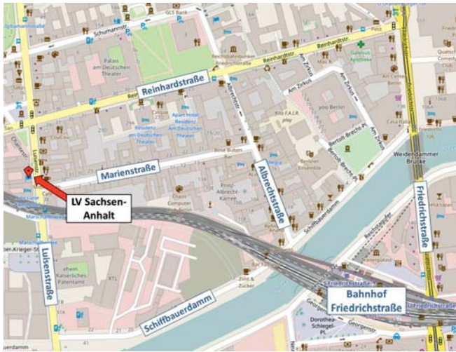
Karte hergestellt aus OpenStreetMap-Daten | Lizenz: Open Database License (ODbL)